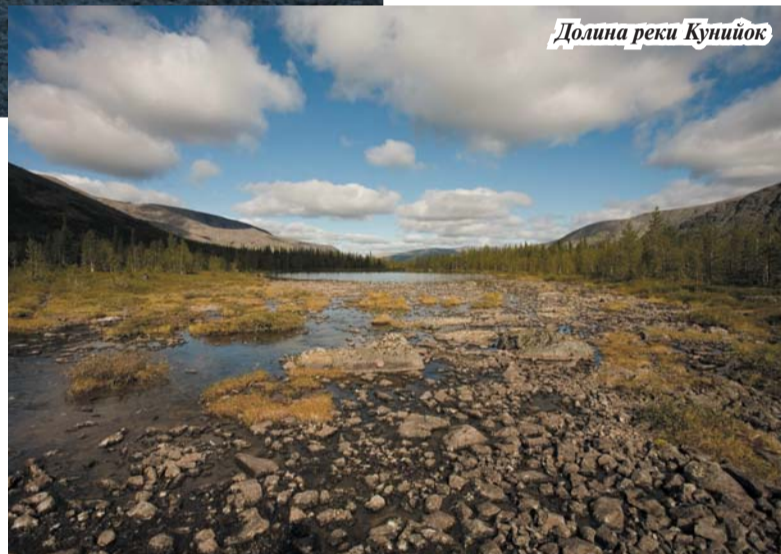
Долина реки Кунийок

Вторым рождением туризма на Кольском можно, по-видимому, считать 1985 г., когда в связи с объявленным СССР мораторием на все ядерные взрывы программа «Ядерные взрывы для народного хозяйства» была свёрнута. С 25-летним юбилеем вас, дорогие любители Хибин!