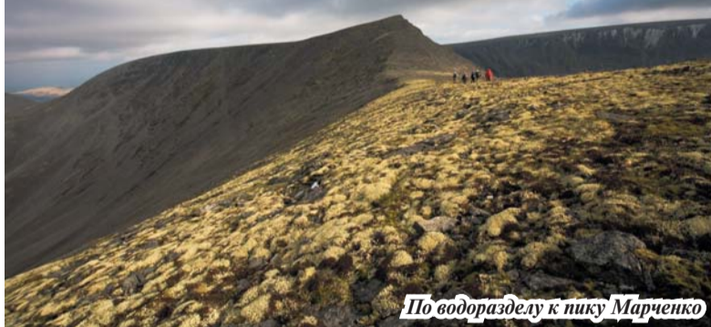
По водоразделу к пику Марченко