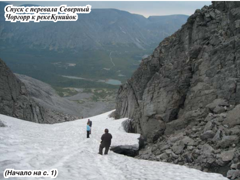
Спуск с перевала Северный Чоргорр к реке Кунийок