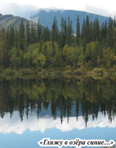
«Гляжу в озёра синие...»

Те путешественники, которые не уверены в своих силах, могут воспользоваться услугами гида (это стоит около 3000 р. в день), который проведёт по намеченным маршрутам и ещё расскажет множество интересных историй.