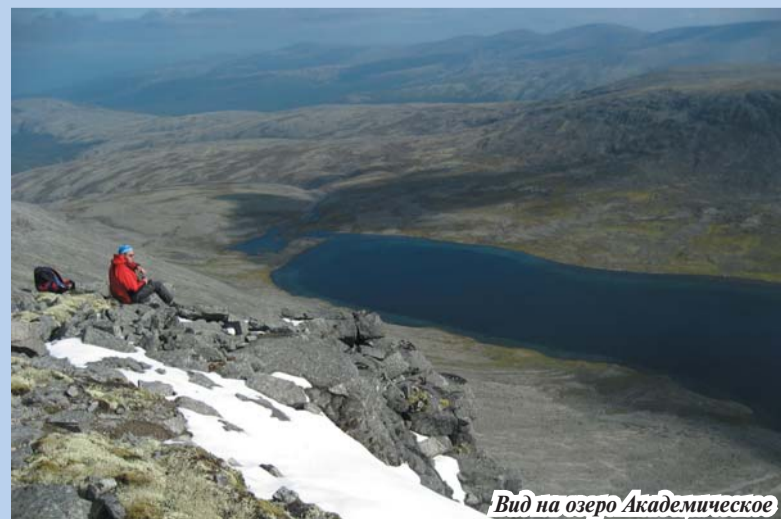
Вид на озеро Академическое