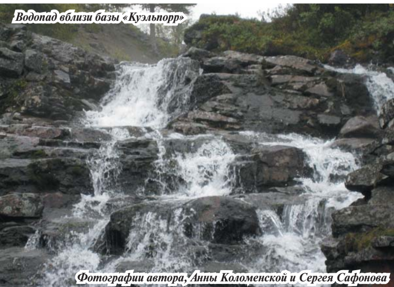
Водопад вблизи базы «Куэльпорр»